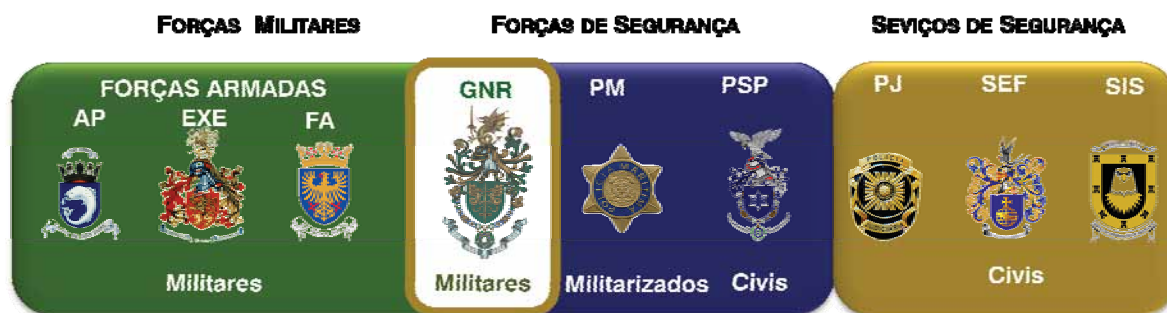
Figura 01 – Posição da Guarda no Sistema Nacional de Forças

Guarda tornam-se ainda mais evidentes, colocando a Instituição na primeira linha da resposta nacional em matéria de segurança e defesa.