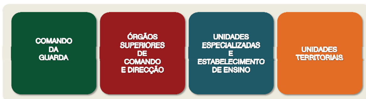
Figura 3 – Organização dos Projectos/Actividades/Acções

Ambicionando conferir um melhor manuseamento, leitura e interpretação de dados do presente documento, foi opção elencar os projectos, actividades e acções a desenvolver organizados por Unidades Orgânicas, estruturadas em quatro tipos, com um nível de detalhe equivalente a Direcção de Serviços, Divisão, Unidade e Comando Territorial, respectivamente, conforme seguidamente se descreve: